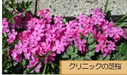
クリニックの芝桜